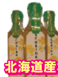
北海道産なたね油 100% 「ECORINA」……10名様 提供 / ㈱エコERC

25社のメニューは 「がぶっとクロス」番組内か ホームページ www.octv.jp でもご覧頂けます!