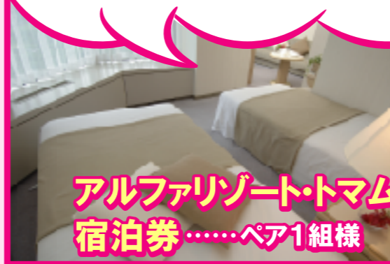
アルファリゾート・トマム 宿泊券……ペア1組様